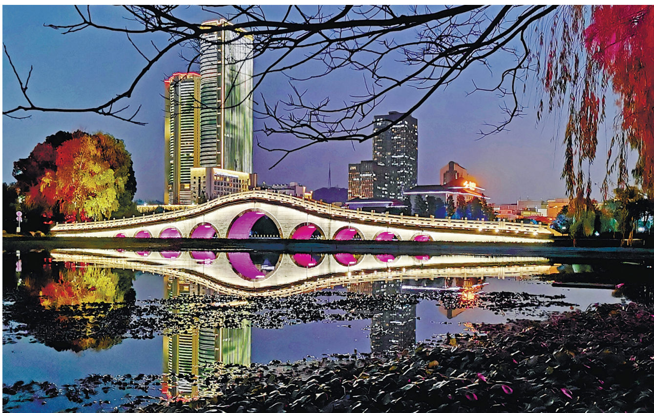
那些时日，一首首小诗就在波光与微荡的湖水中起伏，一行行诗句在脑海中由模糊到清晰，稚嫩的文字便歪歪扭扭地落在了纸上。