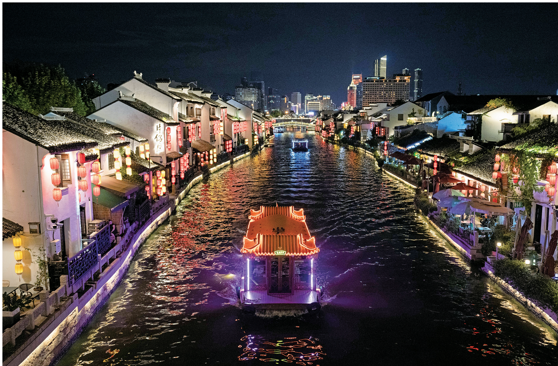
图为9月23日,游船行驶在无锡市古运河上

近年来,江苏以水为脉,以运为络,持续推进水利设施建设与水城综合治理,从大江大河治理到船闸效能升级,从生态修复到产业集聚,不仅筑牢了防汛抗旱的安全底线,更打通了高质量发展的“黄金水道”。