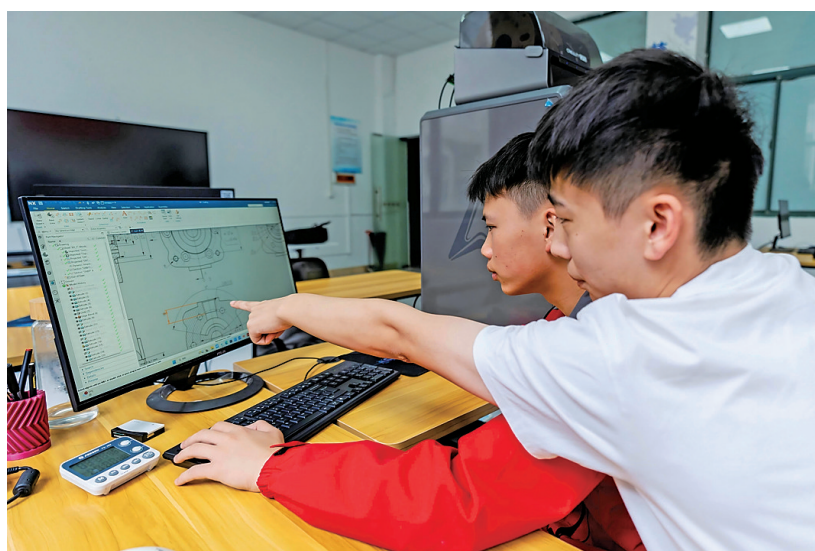
在青苗训练室绘制工程图