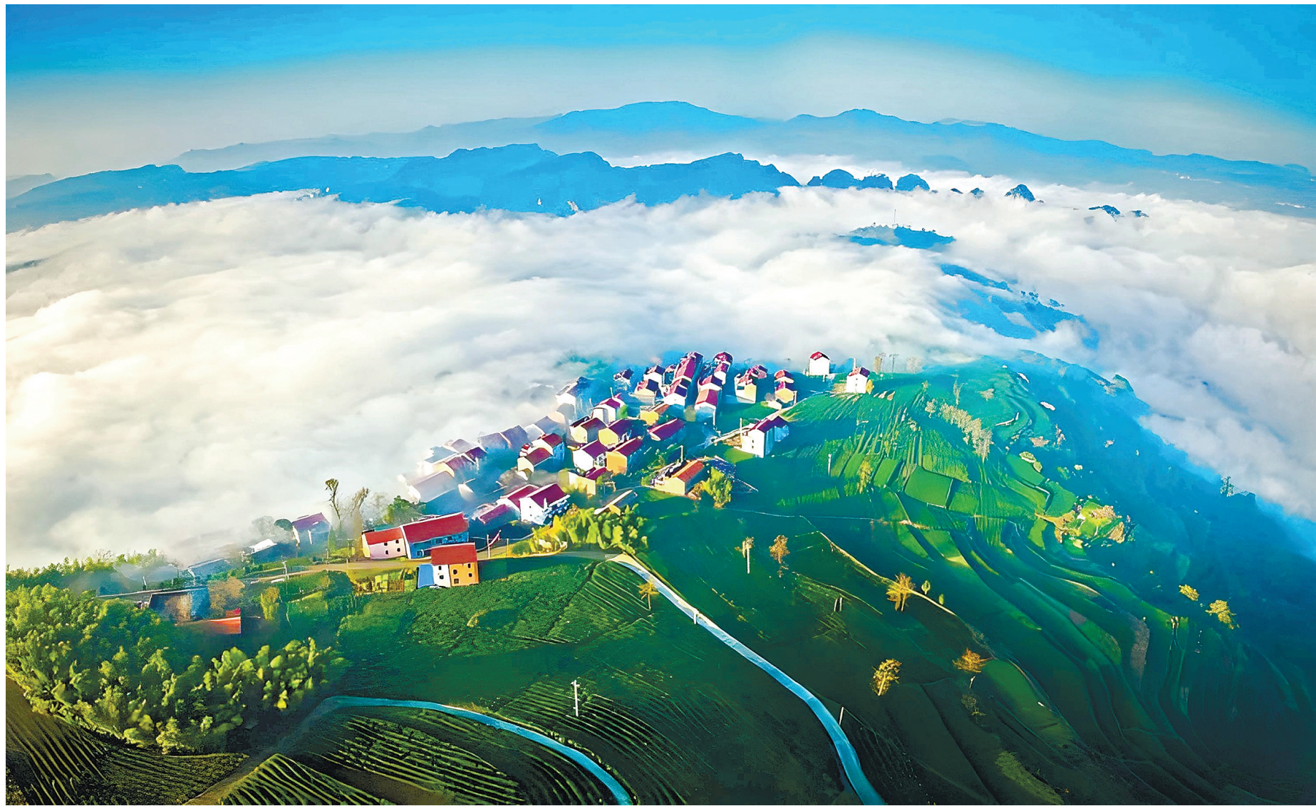
图为“下岩贝·金山上”片区。

“十五五”规划建议要求“分类有序、片区化推进乡村振兴”。当单个村庄面临资源分散、产业薄弱等发展困境时,浙江以改革创新突破瓶颈制约,以“千万工程”牵引城乡融合发展,缩小“三大差距”推进共同富裕先行示范,稳步推进乡村片区组团发展,形成了可复制、可推广的先行经验。