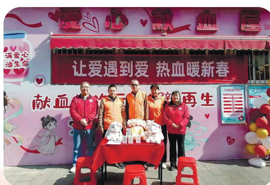
▲无偿献血志愿服务活动