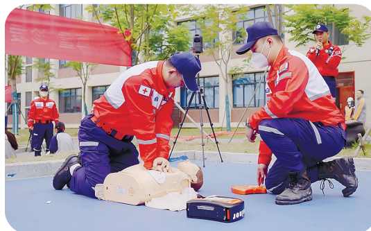
▲市红十字会开展校园地震避险疏散演练