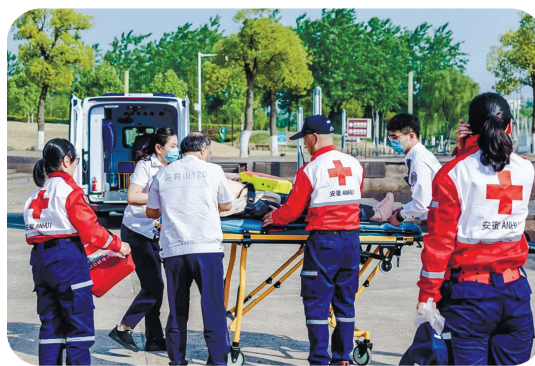
▲市红十字公益救援队开展演练