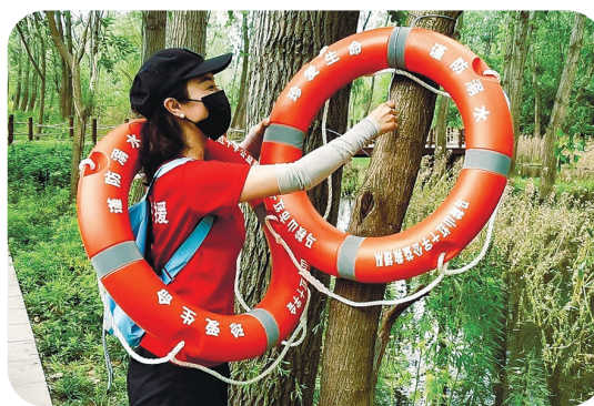
▲市红十字会在全市范围内投放救生圈