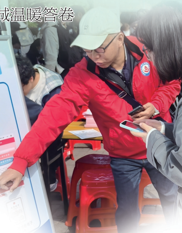
▲2025年,我市成功入选全国造血干细胞信息化试点城市。图为志愿者在高校开展造血干细胞电子化入库工作。