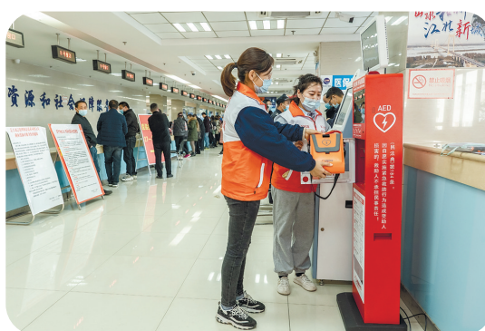
▲市红十字会在市人社局服务窗口投放AED